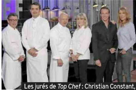
Les jurés de Top Chef : Christian Constant, Jean-François Piège, Thierry Marx et Ghislaine Arabian. Et les animateurs, Stéphane Rotenberg et Agathe Lecaron.